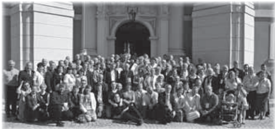
Uczestnicy Podsumowania roku pracy DK w Paradyżu