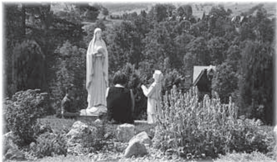
Maryja – wzór Nowego Człowieka

Powyższy cel albo ideał wychowawczy pedagogii nowego człowieka ukazywany jest i przeżywany we wzorach osobowych, którymi są: Chrystus-Sługa i Niepokalana-Służebnica . Zakotwiczenie pedagogii nowego człowieka w osobach podnosi ją do nadprzyrodzonego porządku odkupienia, nadaje jej charakter teologiczny, czyni z niej teologię wychowania.