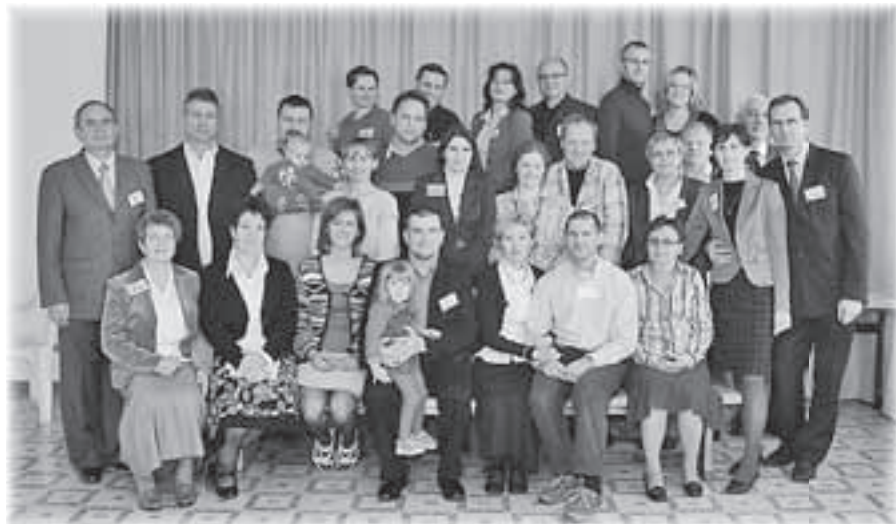
Rekolekcje dla par rejonowych w Brańszczyku

Spotkanie w kręgu było praktycznym ćwiczeniem pokazującym, jak prowadzić spotkanie kręgu rejonowego; w jego trakcie omawialiśmy życie rejonu, modliliśmy się i dzieliśmy Słowem Bożymi, zaś w ostatniej części spotkania dzieliśmy się realizowanymi ostatnio zadaniami pary rejonowej.