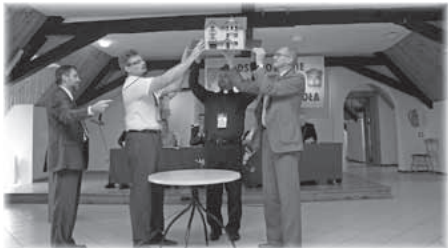
Prezentacja makiety rozbudowy Centralnego Domu Rekolekcyjnego DK w Krościenku