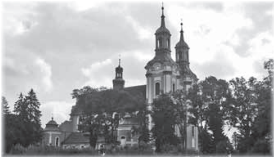
Pocysterski zespół klasztorny w Paradyżu – miejsce tegorocznego Podsumowania DK