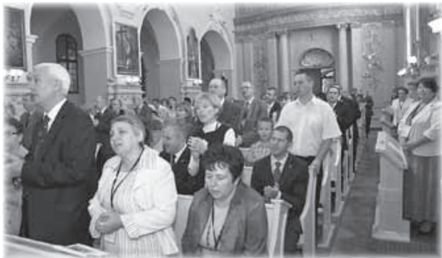
Uczestnicy Podsumowania podczas Eucharystii

odpowiedzialnych w DK były aktem religijnym, poszukiwaniem woli Bożej, a nie nawiązywały do regułu kampanii wyborczych toczonych w świeckim życiu politycznym.