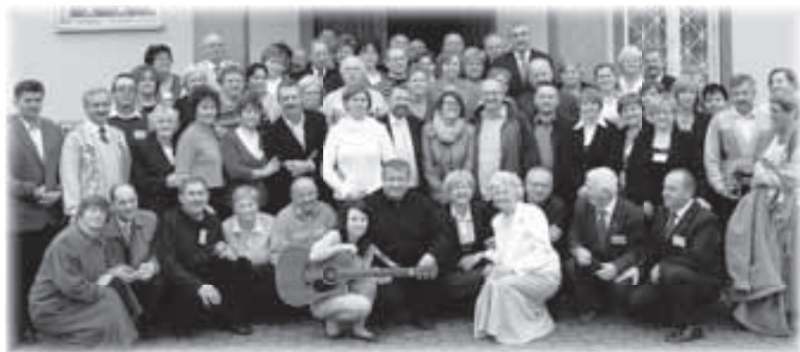
Uczestnicy rekolekcji tematycznych w Dąbrowce

Już w pierwszym Namiocie Spotkania zgłębialiśmy fundament naszej wiary: „Ty jesteś Piotr [czyli Skąła], i na tej Skale zbuduję Kościół mój, a bramy piekielne go nie przemogą” (Mt 16,18). Podczas konferencji Ks. Moderator, powołując się na Pismo Święte i różne dokumenty Kościoła, mówił o Kościele jako Ludzie Bożym zgromadzo-