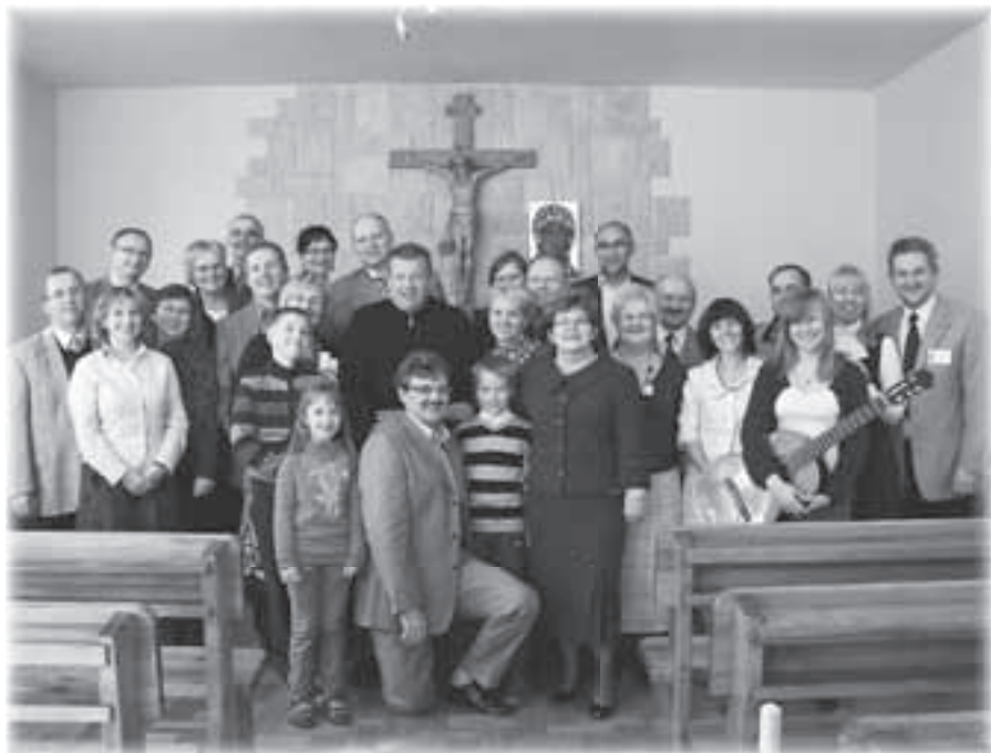
Uczestnicy rekolekcji dla par diecezjalnych

niach, prezentowanych zdjęciach i poświęconym jej filmie. Wielu z nas z rozrzewaniem przypominało sobie chwile spędzone z Siostrą na rekolekcjach czy innych spotkaniach wspólnotowych. Jej wspomniane przez nas żarty i tańce w czasie pogodnych wieczorów dawały obraz radosnego chrześcijanina, jakim każdy z nas powinien być. My dzieliliśmy się radością z tego, że wielokrotnie odwiedzała naszą diecezję i uczyła nas jak być blisko ludzi, troszcząc się jak matka o wierność charyzmatu. Wspólnotę par diecezjalnych umacniało obieranie ziemniaków i zmywanie talerzy oraz dzielenie się doświadczeniem posługiwania w Ruchu w różnych częściach Polski.